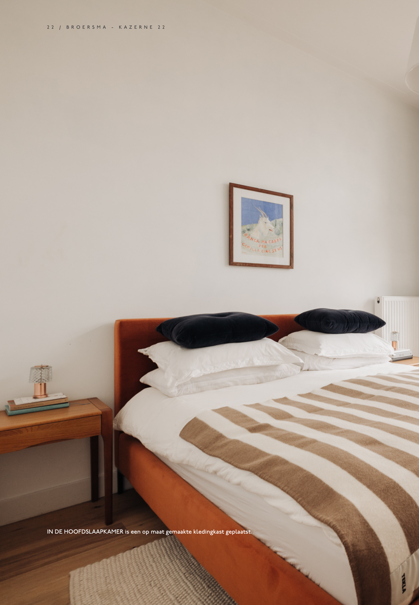
IN DE HOOFDslaapkamer is een op maat gemaakte kledingkast geplaatst.