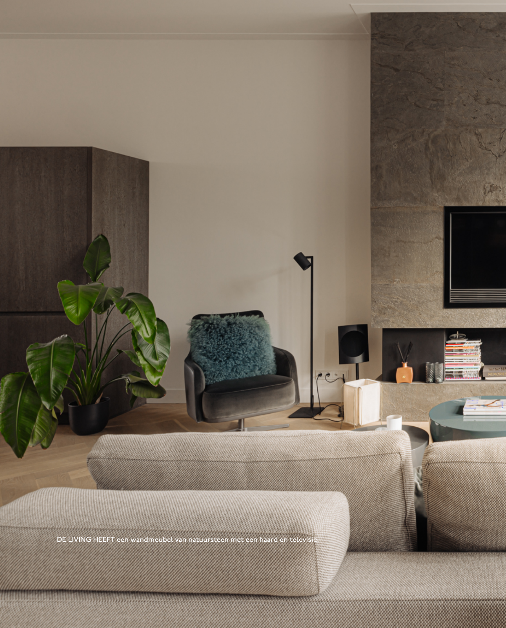
DE LIVING HEEFT een wandmeubel van natuursteen met een haard en televisie.