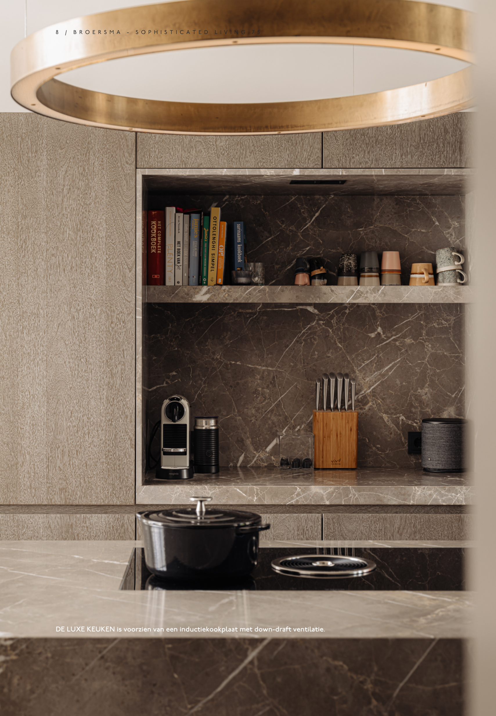
DE LUXE KEUKEN is voorzien van een inductiekookplaat met down-draft ventilatie.