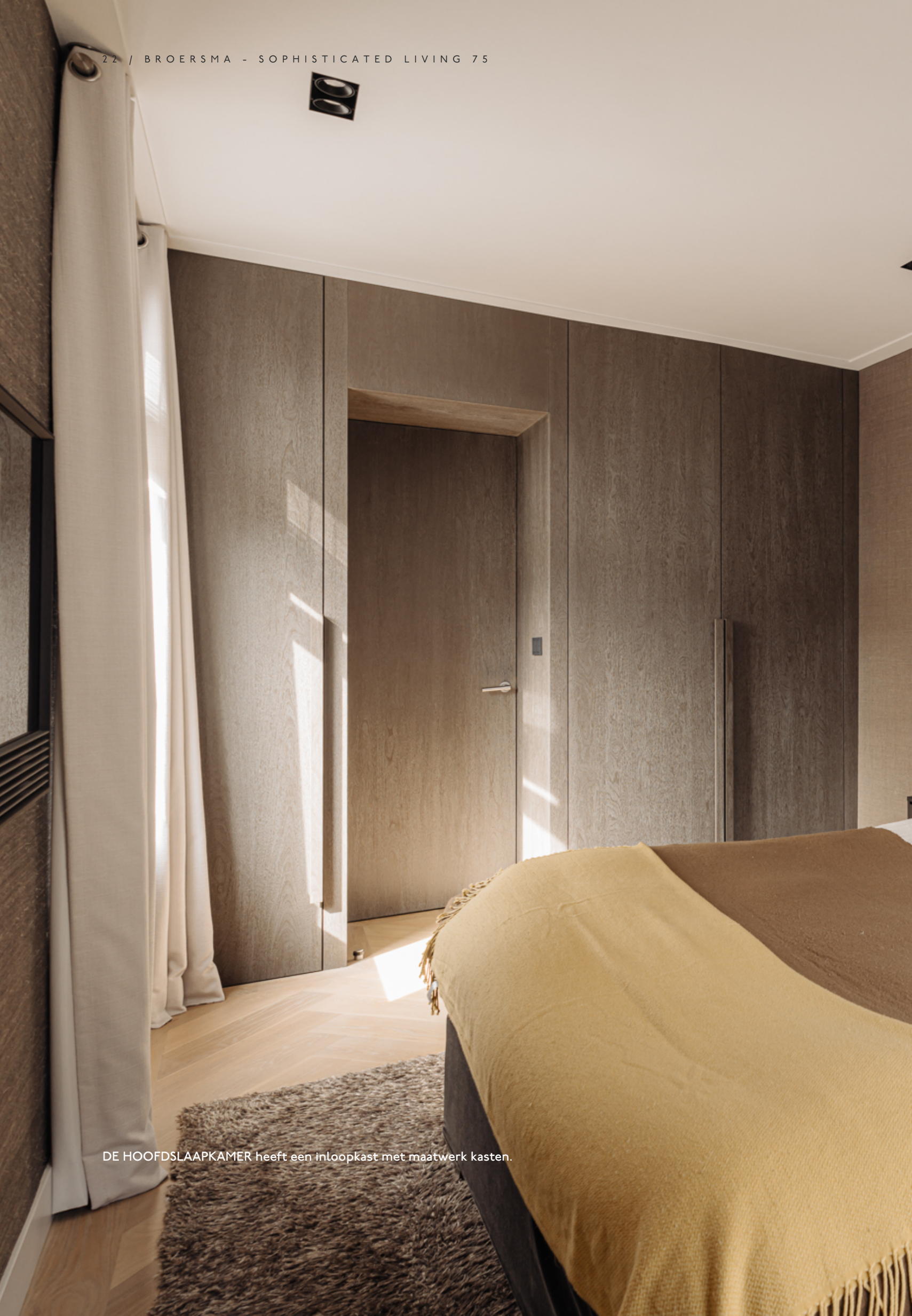
DE HOOFDSLAPKAMER heeft een inloopkast met maatwerk kasten.