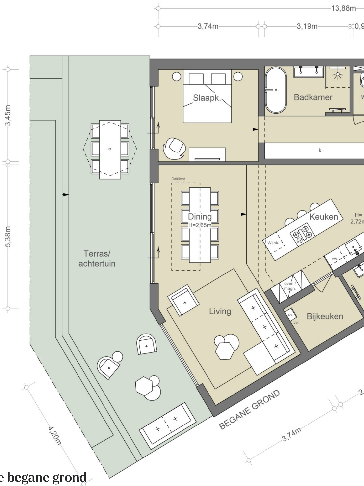
De begane grond