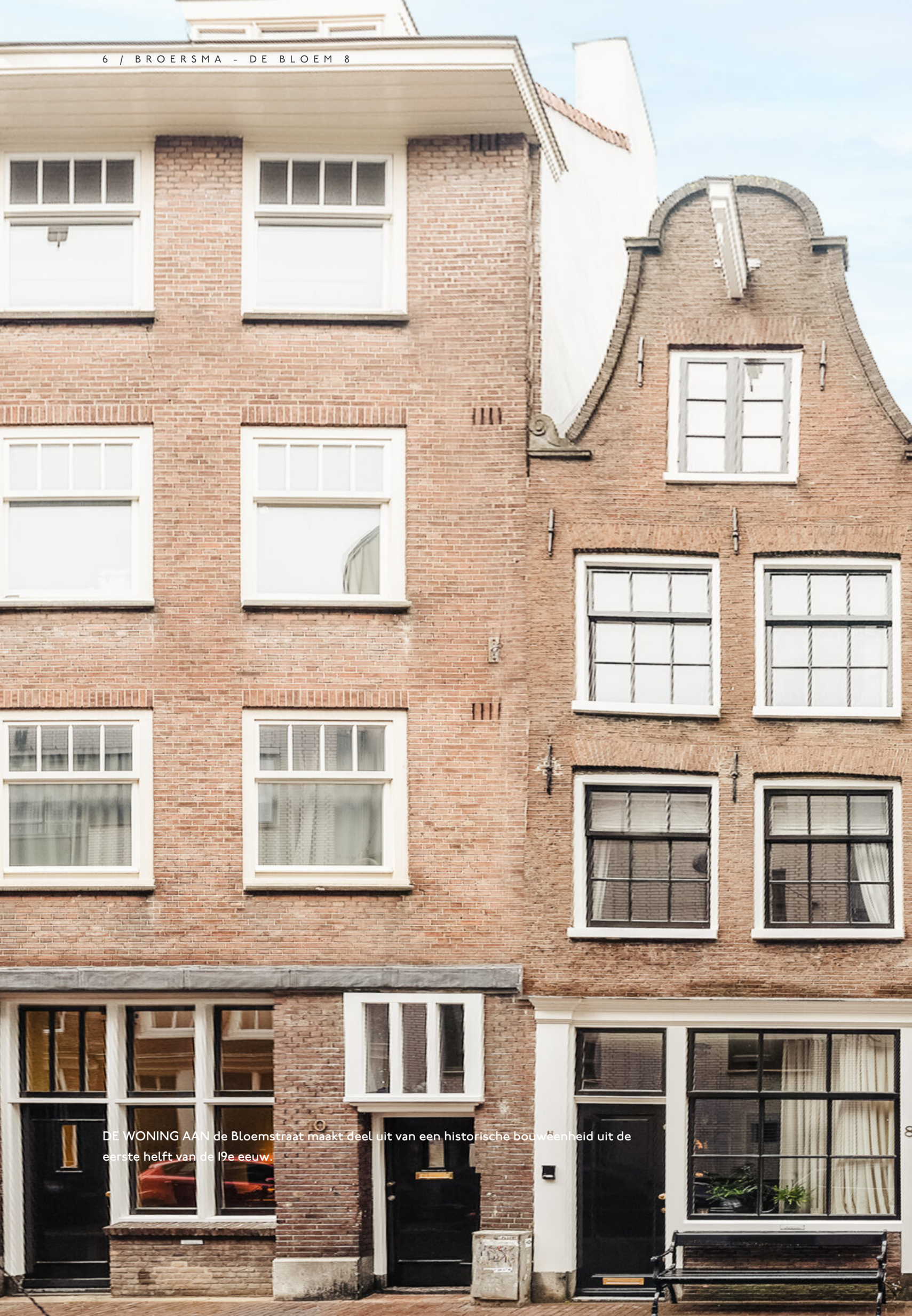
DE WONING AAN de Bloemstraat maakt deel uit van een historische bouweenheid uit de eerste helft van de 19e eeuw.