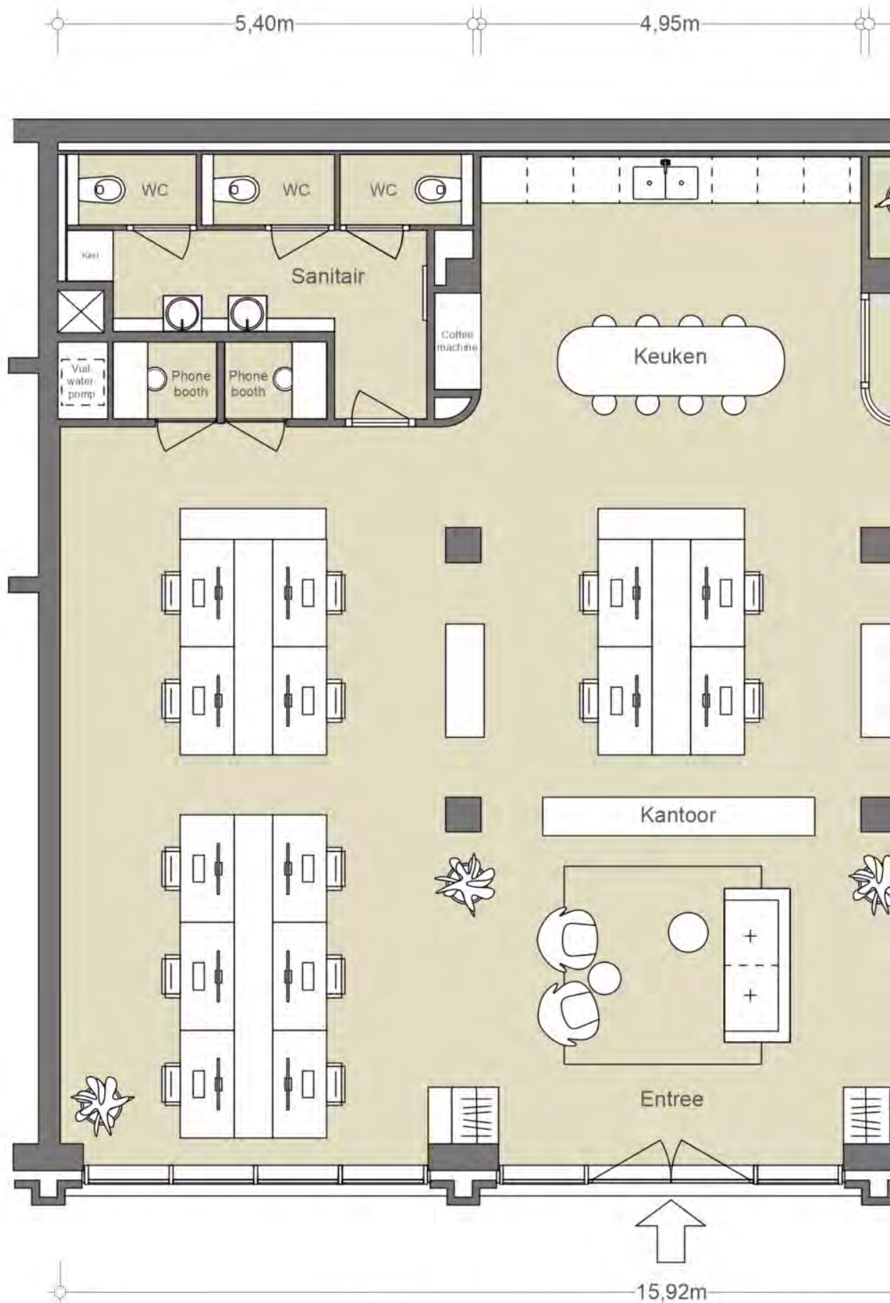
- ALTERNATIEVE INDELING